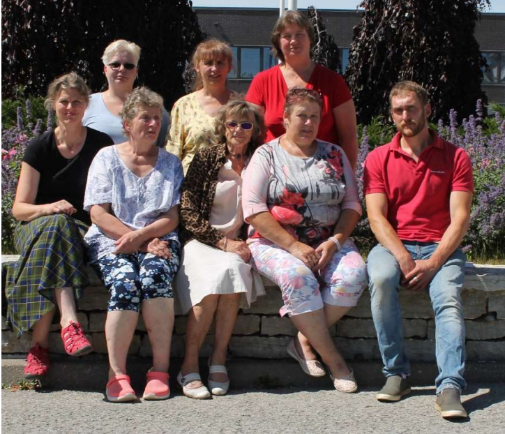
Foto 6. EK Seltsi juhatuse ja revisjonikomisjoni liikmed (puudub Ants Aamann)

Suur ja südamlük tänu kõikidele maakarja kasvatajatele, ilma Teieta ei ole Seltsi tegevusel eesmärki!