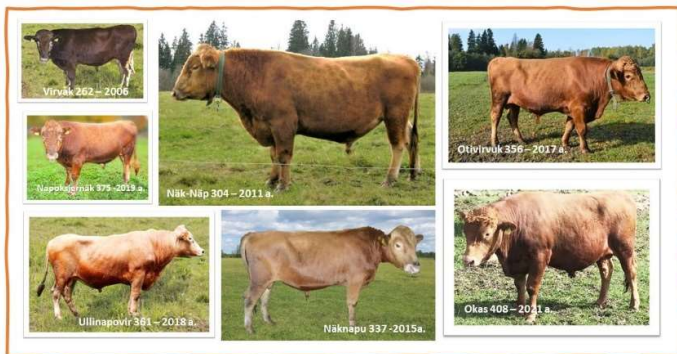
Foto 3. Merja Magnuse ja Enno Lohu poolt üleskasvatatud spermavullid

Klaasmeenetega tänati kauaaegseid maakarja edendajaid ja toetajaid: